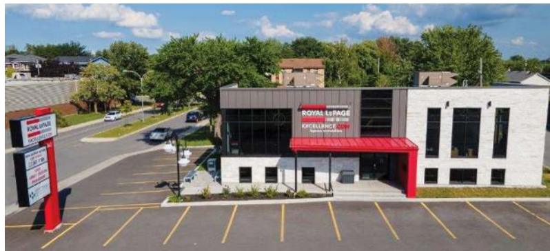
943 BLV. DU SÉMINAIRE NORD, ST-JEAN-SUR-RICHELIEU