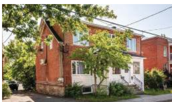
TRIPLEX ST-JEAN 475 000$