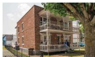
DUPLEX GRANBY 359 000$