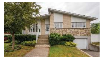
4 CHAMBRES LONGUEUIL 2 700$/MOIS