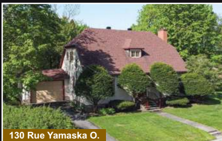
130 Rue Yamaska O.

Bedford. Impeccable plain-pied de 3 chambres, terrain de 13 113 pc. Grande aire ouverte.