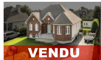
VENDU IMPECCABLE - RECHERCHÉ ST-JEAN 569 000$