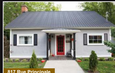
817 Rue Principale

Canton de Bedford, terrain boisé de 40 321 pc prêt à bâtir, secteur paisible à proximité des services.