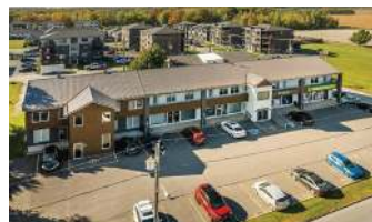
8 PLEX RÉ.S. ET COMM. VENISE 1 875 000$ + TX