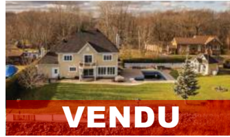
VENDU SITE SPECTACULAIRE ST-BLAISE 1 125 000$