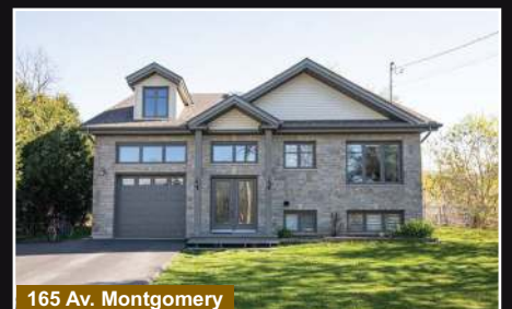
165 Av. Montgomery

St-Armand. Belle propriété 2015, 3 chambres terrain 10 193 pc. spa. Près du quai de la Baie Missisquoi.