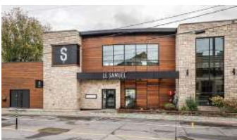
MODERNE-BORD DE L'EAU ST-JEAN 2 500 000$ + TX