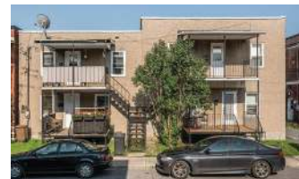
QUADRUPLEX ST-JEAN 529 000$