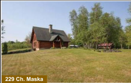
229 Ch. Maska

Dunham. Incroyable maison de bois rond à cachet unique sur un terrain de 47 acres, 20 acres cultivables