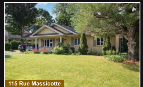
115 Rue Massicotte

Bedford. Impeccable plain-pied de 3 chambres, terrain de 13 113 pc. Grande aire ouverte.