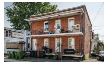
QUINTUPLEX ST-JEAN 649 000$