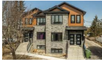
DUPLEX MODERNE NAPIERVILLE 599 000$ + TX