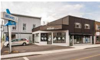
ENTREPRISE ST-JEAN 325 000 + TX