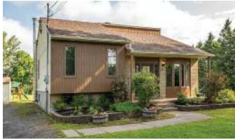
TERRAIN 51 410 PC ST-JEAN 497 000$