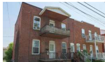
SOLIDE DUPLEX ST-JEAN 354 000$