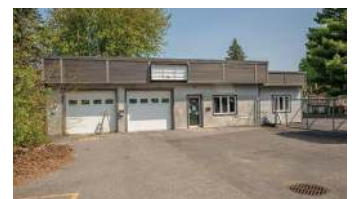
BÂTISSSE 2 776 PC ST-JEAN 2 995$+TX/MOIS