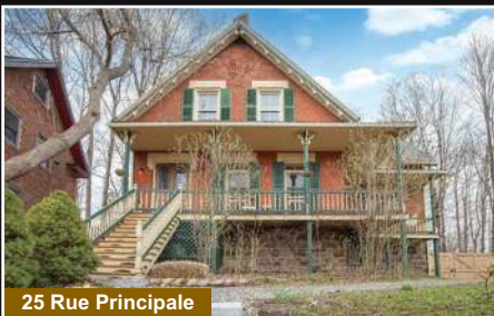
25 Rue Principale

Farnham. Splendide propriété sur un terrain boisé de 41 290 pc. Garage isolé et chauffé 2 étage habitable.