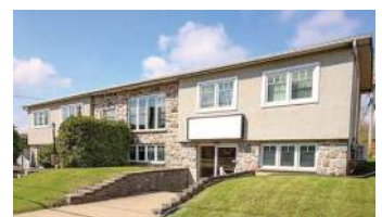
À LOUER - BLV SÉMINAIRE ST-JEAN 2 100$+TX/MOIS