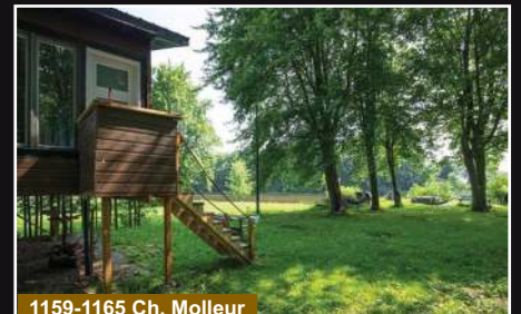
1159-1165 Ch. Mollieur

Cowansville. Maison historique bien entretenue. 4 chambres. Planchers d'origine sablés et vernis 2021