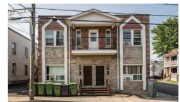
8 PLEX ST-JEAN 1 115 000$