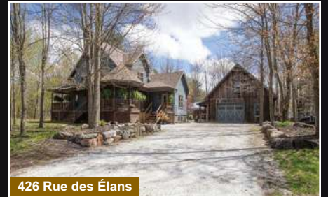
426 Rue des Élans

Bedford. Plus de 10 000 pieds carrés d'espace industriel léger/commercial/bureau selon vos besoins.