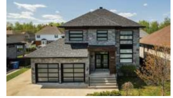
HAUT DE GAMME ST-HUBERT 1 350 000$