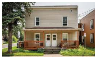
TRIPLEX FARNHAM 339 000$