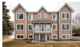
SIXPLEX (6x 5 1/2) STE-BRIGIDE 1 275 000$