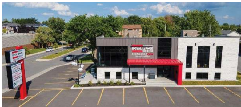
943 blv. du Séminaire Nord, Saint-Jean-sur-Richelieu