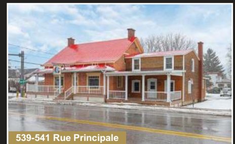
539-541 Rue Principale

Ste-Sabine. Aucun voisin à l'arrière! Chaleureux plain-pied bien entretenu 3 chambres et bureau.