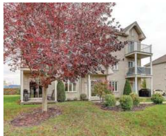
6 PLEX ST-JEAN 1 300 000$