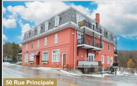
50 Rue Principale

St-Armand. Clé en main! Joli plain-pied avec grand garage, terrain boisé près de 32 000 pc foyer au bois.