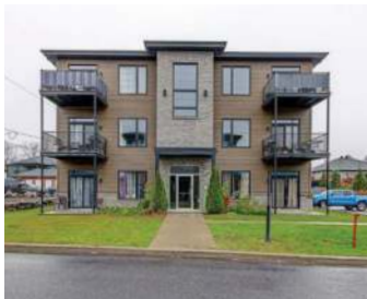
6 PLEX COWANSVILLE 1 249 000$