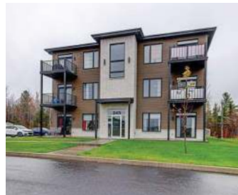
6 PLEX COWANSVILLE 1 320 000$