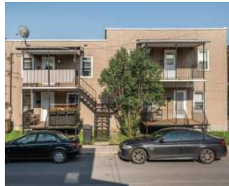
QUADRUPLEX ST-JEAN 439 900$