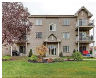
6 PLEX ST-JEAN 1 250 000$