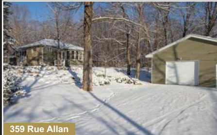
359 Rue Allan

St-Armand. Clé en main! Joli plain-pied avec grand garage, terrain boisé près de 32 000 pc foyer au bois.