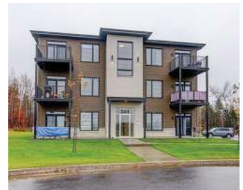
6 PLEX COWANSVILLE 1 320 000$