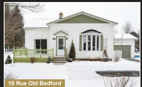
10 Rue Old Bedford

Stanbridge East. Terrain de plus de 16 000 pc, aire ouverte, grand atelier, route des vins.