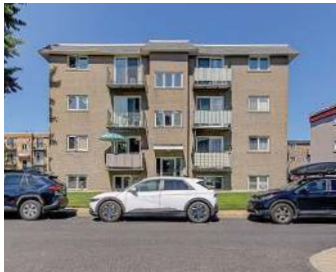
8 PLEX ST-JEAN 1 250 000$