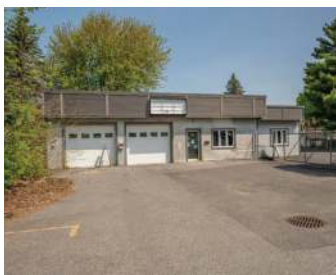
BÂTISSSE 2 776 PC ST-JEAN 585 000$+tx