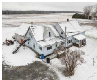
ANCESTRALE - 9.2 ARPENTS NOYAN 325 000$