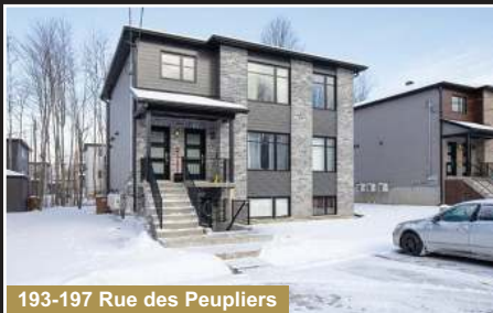
193-197 Rue des Peupliers

Bedford. En bordure de la rivière aux Brochets, 4 chambres, cachet rustique grande cuisine avec îlot.