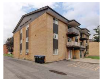
12 PLEX ST-JEAN 1 595 000$