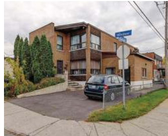
QUINTUPLEX ST-HUBERT 989 000$