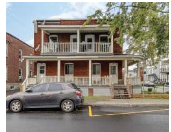
6 PLEX ST-JEAN 850 000$