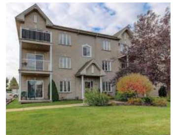
6 PLEX ST-JEAN 1 200 000$