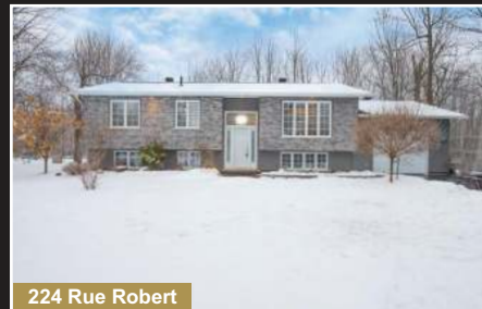
224 Rue Robert

Farnham. Superbe triplex (3x 5 1/2) 2019 aménagé avec goût! Secteur paisible, près des services.