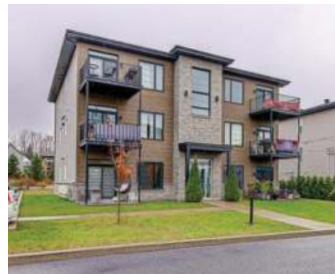
6 PLEX COWANSVILLE 1 249 000$