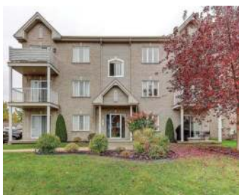
6 PLEX ST-JEAN 1 330 000$