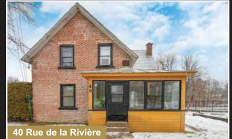
40 Rue de la Rivière

Frelighsburg. Très grand condo de 2 càc, aire ouverte, foyer au gaz, îlot, plafond de 10 pieds.