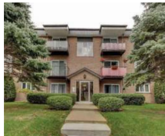
12 PLEX ST-JEAN 1 595 000$