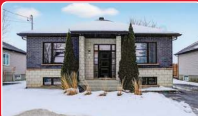
ST-JEAN 649 900$ Clé en main! Magnifique propriété 2013, au goût du jour, offrant 4 chambres. Magnifique cuisine, Aire ouverte lumineuse, finition soignée et confort assuré grâce à la thermopompe murale. Superbe cour arrière aménagée avec piscine, grande terrasse. Secteur paisible. Centris 19190138