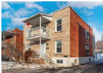
ST-JEAN-SUR-RICHELIEU - DUPLEX 525 000$ - MLS 25453317