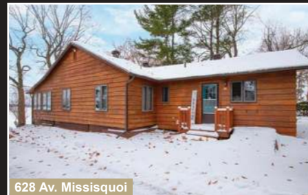
628 Av. Missisquoi

Farnham. Maison 2022 au goût du jour, secteur paisible sans voisin à l'arrière. 5 chambres, aire ouverte.