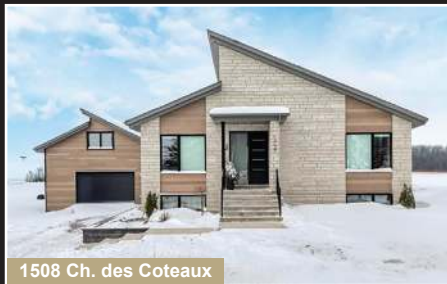
1508 Ch. des Coteaux

Brigham. Superbe propriété de style Viceroy avec garage, nichée sur un terrain de plus de 2 acres.