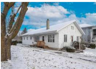
NAPIERVILLE - 4 CHAMBRES 389 000$ - MLS 15798155