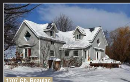
1707 Ch. Beaulac

Stanbridge East. Superbe propriété au goût du jour, 4 chambres, 2 SDB complètes, aire ouverte.