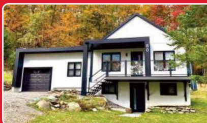
AUSTIN 725 000$ RÉNOVÉ AVEC AGRANDISSEMENT 2022. Un havre de paix sur une rue sans issue à 15 min. de Magog et du Mont Orford. Superbe terrain boisé de plus de 42 000 pc. Accès aux 2 plages du lac Webster. Intérieur impeccable et lumineux. Centris 12747821