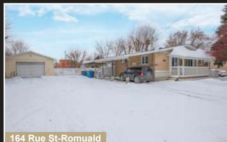
164 Rue St-Romuald

St-Armand. Charmante propriété, terrain de plus de 59 000 pc entouré d'un paysage enchanteur.