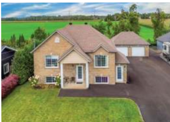
ST-CYPRIEN-DE-NAPIERVILLE - DUPLEX 725 000$ - MLS 28830792