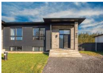
NOYAN - 3 CHAMBRES 360 626$ + TX (409 000$) - MLS 20110566