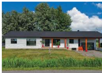
STE-ANNE-DE-SABREVOIS - 6 CHAMBRES 739 000$ OU 3 750$/MOIS - MLS 14410920