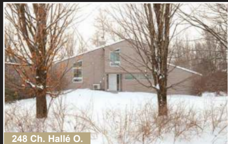
248 Ch. Hallé O.

CONTACTEZ-NOUS POUR VENDRE OU ACHETER UNE PROPRIÉTÉ! century21realisation.com 450.248.9099