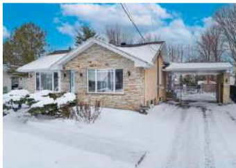
LACOLLE - 4 CHAMBRES 549 000$ - MLS 17376961