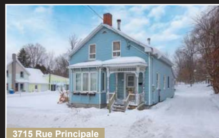
3715 Rue Principale

East Farnham. Terrain exceptionnel, près de 15,000 pc, avec fondation coulée et plans inclus!