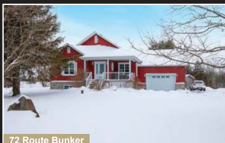
72 Route Bunker

Stanbridge East. Immense terrain d'un peu plus de 30 hectares avec partie boisé.