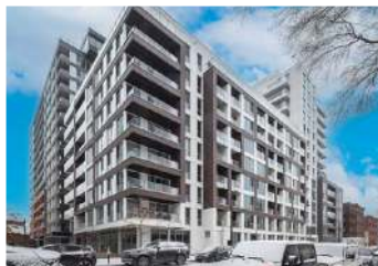
MONTREAL (VILLE-MARIE) - 1 CHAMBRE 350 000$ - MLS 24209394