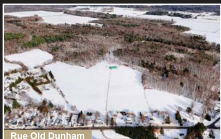
Rue Old Dunham

Venise-en-Québec. Bord du Lac Champlain avec vue imprenable sur l'eau et les montagnes.