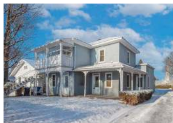
NAPIERVILLE - DUPLEX 475 000$ - MLS 26785908