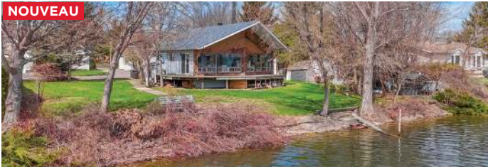
SAINT-PAUL-DE-L'ÎLE-AUX-NOIX - 3 CHAMBRES - 450 000$ - MLS 19225434