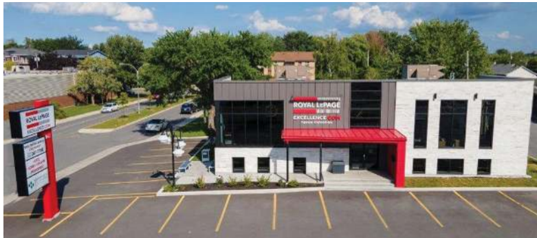
943 blv. du Séminaire Nord, Saint-Jean-sur-Richelieu