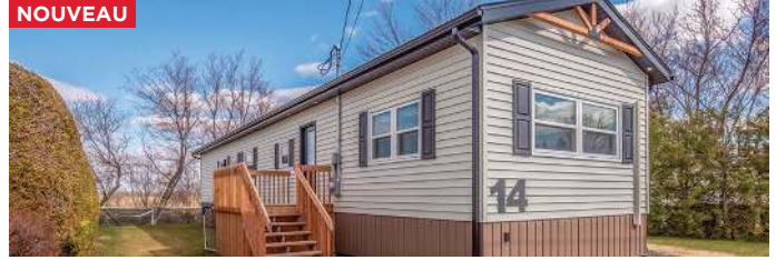
LACOLLE - 3 CHAMBRES - 350 000$ - MLS 9222572