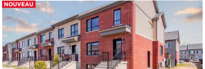
SAINT-RÉMI - 2 CHAMBRES - 514 900$ - MLS 19971894