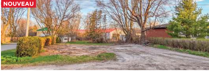
SAINT-PATRICE-DE-SHERRINGTON - TERRAIN - 275 000$ - MLS 11647047