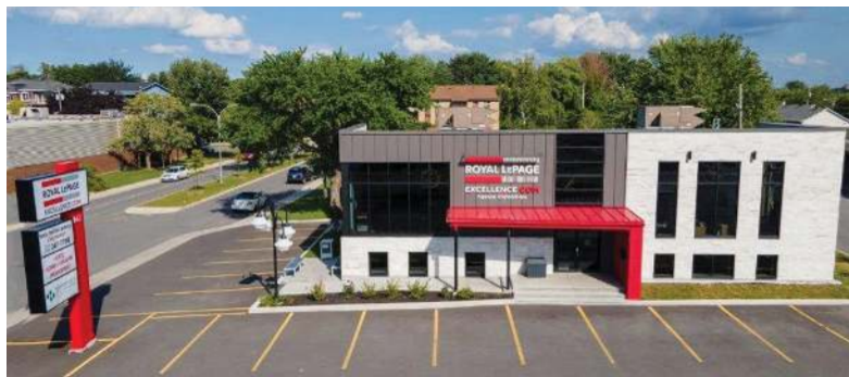
943 blv. du Séminaire Nord, Saint-Jean-sur-Richelieu